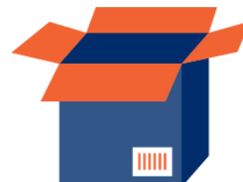
GTIN des Case mit 6 x Multi-Pack mit je 3 Gläsern

Gerne steht Ihnen das Team von GS1 für weitere Fragen zur Verfügung.