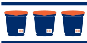
GTIN des Multi-Pack mit 3 Gläsern